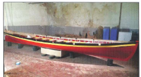
Août-septembre : aménagement intérieur