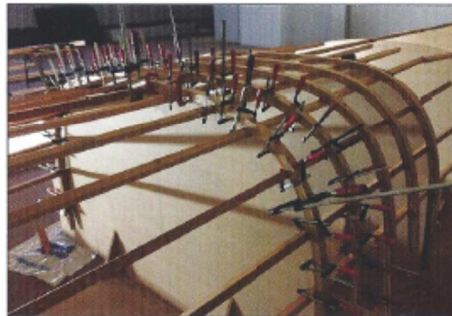
Mars-avril : lamelage des 43 membrures